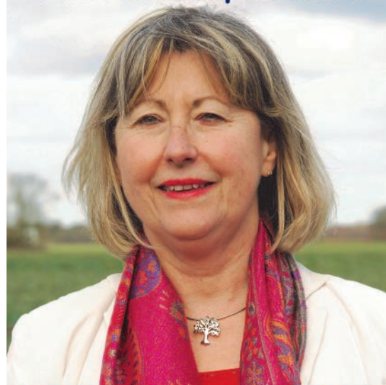
Votre Maire fidèle à St Pierre du Perray élections municipales de mars 2020