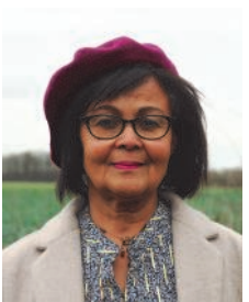
Zouhouroi Ferblantier Bois d'Amour Adjointe au Maire Retraîtée fonction publique