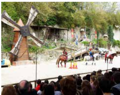
Sortie à Provins le 14 avril 2016