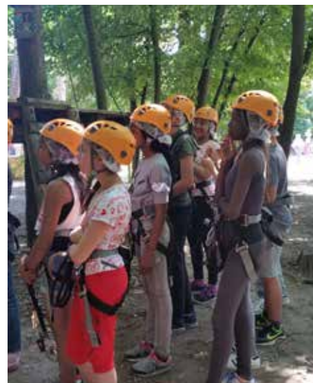
Accrobranche pour le Service Jeunesse