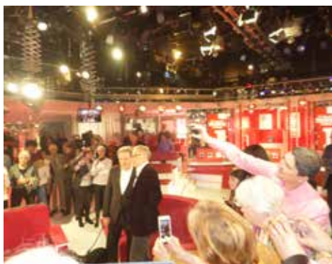
Enregistrement TV «Vivement dimanche»