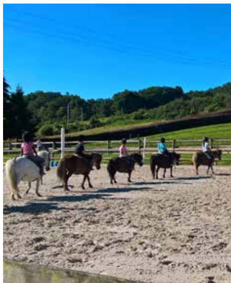
Stage d'équitation à Conches-en-Ouche