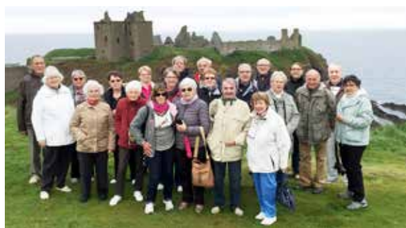
Voyage des seniors en Ecosse du 7 au 14 juin 2016