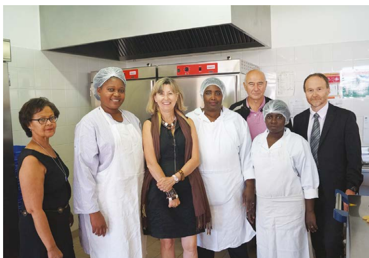
A chaque rentrée scolaire, les élus rencontrent le personnel de restauration.

La livraison des repas est opérée avec des camions frigorifiques. Les repas sont transportés dans des paniers plastiques lavés et désinfectés quotidiennement. Les repas sont réceptionnés et contrôlés par notre personnel de restauration. Menées par nos responsables d'office, nos équipes de restauration suivent scrupuleusement les indications fournies pour préparer les repas. Découpe, présentation, remise en température, service en self ou en salle, nos équipes ne ménagent pas leurs efforts pour assurer un service de qualité.