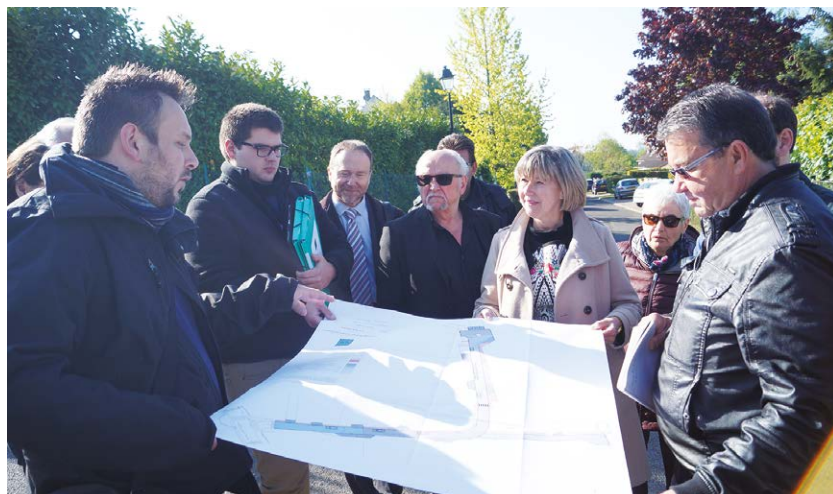
Réunion dans la rue des Vignes le 29 avril

Sur place, le Maître d'oeuvre a présenté aux habitants un projet d'aménagement de la rue des Vignes et a pu répondre à toutes les questions. Cette concertation avec la prise en compte des suggestions des riverains va permettre de réaliser des aménagements dans cette rue afin de renforcer le cadre de vie et le bien-vivre ensemble.