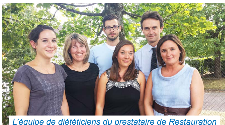
L'équipe de diététiciens du prestataire de Restauration

La livraison des repas est opérée avec des camions frigorifiques. Les repas sont transportés dans des paniers plastiques lavés et désinfectés quotidiennement. Les repas sont réceptionnés et contrôlés par notre personnel de restauration. Menées par nos responsables d'office, nos équipes de restauration suivent scrupuleusement les indications fournies pour préparer les repas. Découpe, présentation, remise en température, service en self ou en salle, nos équipes ne ménagent pas leurs efforts pour assurer un service de qualité.