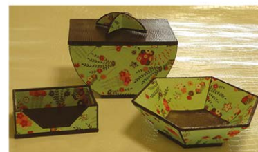
œuvres réalisées par les élèves de la section cartonnage