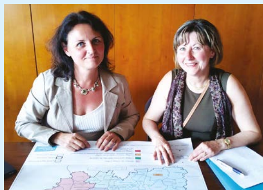
Réunion de travail au Conseil départemental

Il faut d'ores et déjà étudier toutes les pistes : redéfinir la carte scolaire, réaliser une extension du collège Camille Claudel ou construire un nouveau collège à Saint-Pierre.