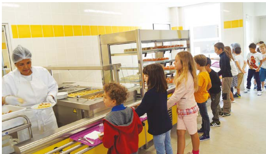
Les élémentaires de Chantefables profitent depuis la rentrée du self

les élémentaires. Les équipes périscolaires ont été formées dès le 1 er septembre afin d'assurer le bon fonctionnement et la bonne organisation des installations. Les Atsem et les équipes d'animation veillent à l'accompagnement des plus jeunes dans cet instant repas. Enfin depuis la rentrée, la Municipalité a équipé l'ensemble de ses écoles d'un dispositif de sécurité PPMS (Plan Particulier de Mise en Sécurité) pour un montant de 46 200 euros.