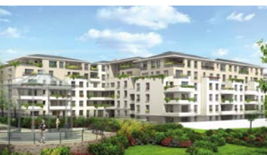
CORBEIL-ESSONNES (91) DIANE AU PIED D'UN PARC DE 2 HECTARES