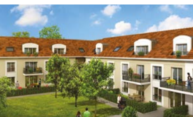
MENNECY (91) LE CLOS RENAULT RÉSIDENTE INTIMISTE