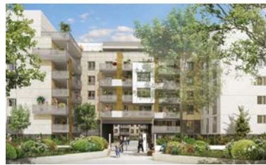
VILLEJUIF (94) APOLLINAIRE AU PIED DU MÉTRO