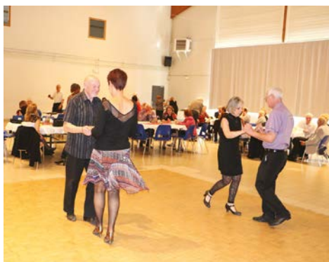
Thé dansant le 30 mars 2017