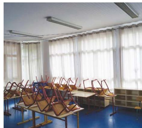
Pose de rideaux dans les salles de classes