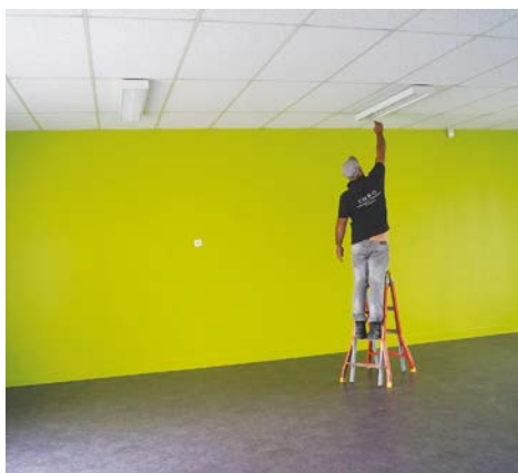
Réfection du sol et des peintures dans la salle polyvalente