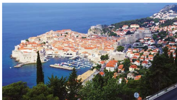
Voyage des seniors en Croatie du 21 au 28 juin 2017