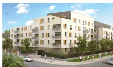
JOUY-LE-MOUTIER (95) RÉSIDENTE CONTI DANS LE NOUVEAU QUARTIER