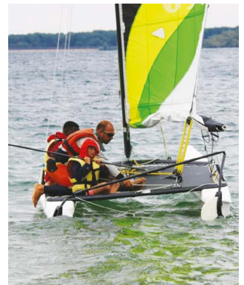
Séjour d'été dans l'Aube du Service Jeunesse