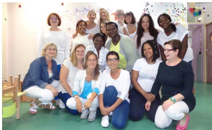
L'équipe de la Maison des petits pas

Afin de célébrer la fin de l'année scolaire des multi-accueils, les établissements d'accueil du jeune enfant du SIPEJ ont organisé des événements originaux pour les familles :