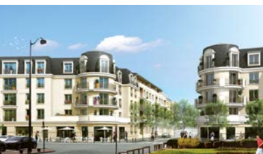
CORBEIL-ESSONNES (91) CŒUR DE VILLE AU CENTRE VILLE