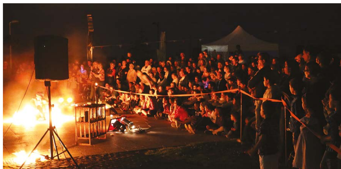
Spectacle de feu