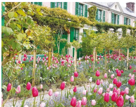
Sortie à Giverny le 25 avril 2017