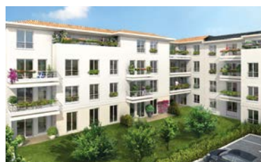
BRIE COMTE ROBERT (77) RÉSIDENTE L'AMADEUS EN CŒUR PAVILLONNAIRE

Découvrez toutes nos offres en bureau de vente ou au