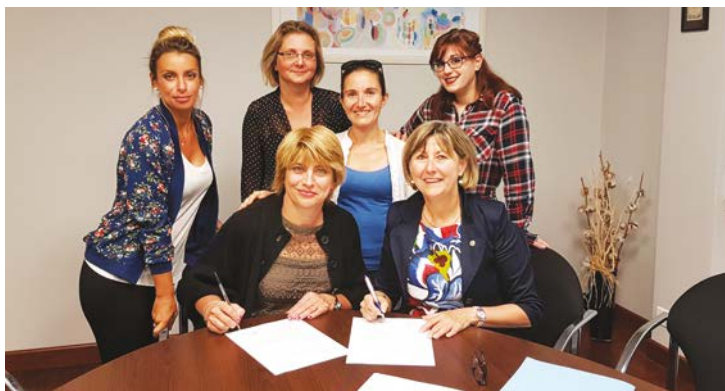
Signature du contrat entre l'îlot papillons et la Mairie