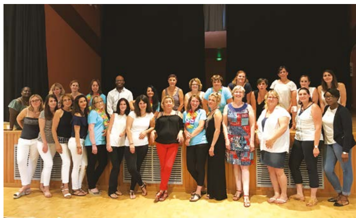
L'équipe des «P'tits Grillons»