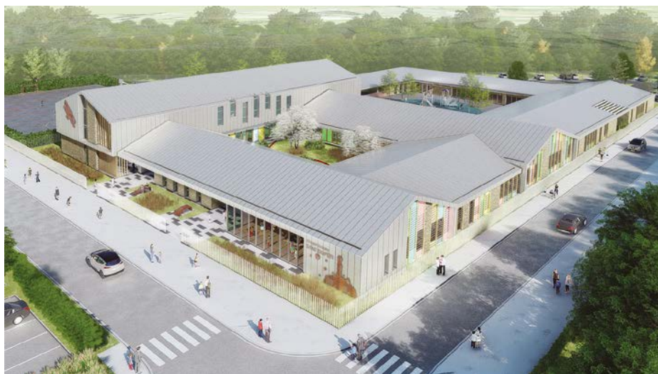
Perspective de la future école Saint-Exupéry dans la Clé de Saint-Pierre. Alliance de modernité et de respect de l'environnement...

Afin de permettre à tous les parents d'accompagner leurs enfants en toute sécurité, un parking de 28 places de stationnement est prévu ainsi qu'un abri pour les 2 roues de 35 places.