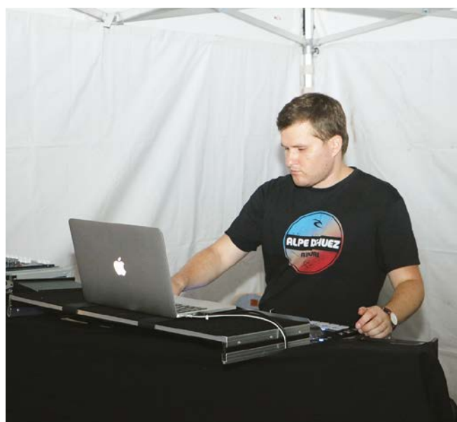
Ambiance musicale avec D.J.