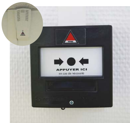
Dispositif de sécurité PPMS

Des travaux se sont déroulés sur l'école Chantefables afin d'améliorer les conditions de la pause déjeuner. Elle se voit ainsi équipée depuis la rentrée de septembre d'un self d'une moyenne de 140 repas/jour pour