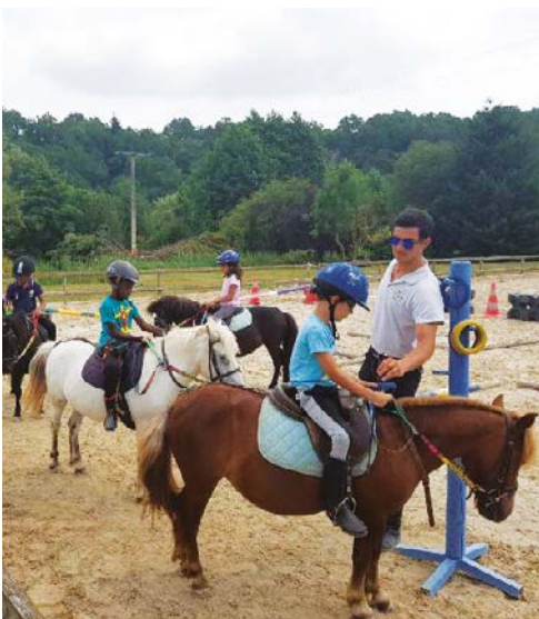
Stage d'équitation à Conches-en-Ouche