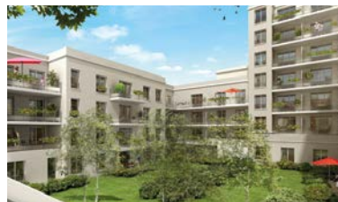
ATHIS-MONS (91) RÉSIDENTE DELAUNE AU PIED DU TRAMWAY LIGNE 7