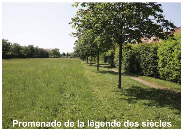
Promenade de la légende des siècles

S aint-Pierre-du-Perray est inscrite au concours Villes et Villages fleuris. Pour concourir et obtenir ce label, la gestion de l'environnement doit être prise en compte dans son ensemble. Cela regroupe les actions en faveur de la faune et de la flore et la qualité de l'espace public. La gestion différenciée, pour protéger notre environnement, fait partie de cette démarche.