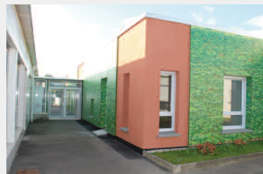
Extension de la salle de restauration à Manureva

Une étude sera également lancée concernant la réfection de la toiture du Groupe scolaire Anne Frank.