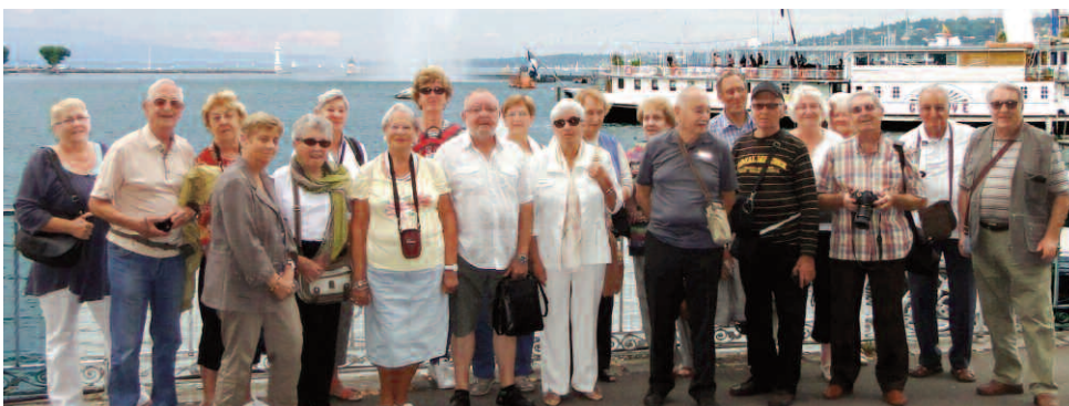
Voyage des seniors à Evian-lès-Bains du 13 au 20 septembre