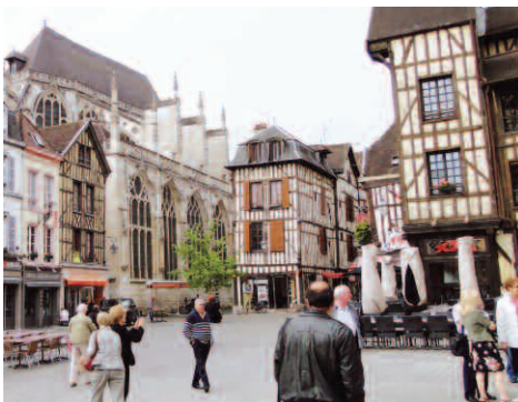
Sortie de Printemps à Troyes