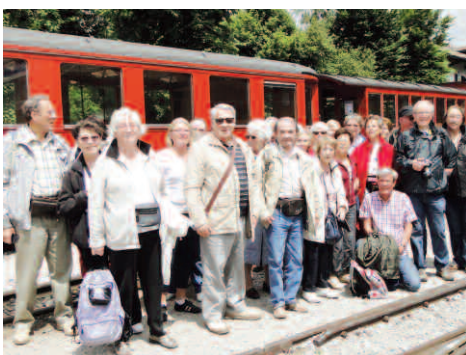
Séjour en Autriche