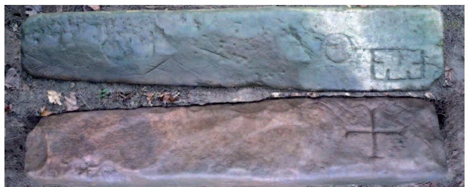
Les deux faces gravées de la stèle

Le style de l'ensemble des gravures ainsi que le lieu proche d'une "Motte Castrale" nous a permis de dater cette stèle de l'époque médiévale et plus précisément des X e à XII e siècles.