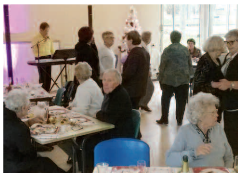
Thé dansant de l'UNRPA le 7 décembre 2014