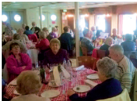
Sortie bateau mouche le 30 novembre 2014