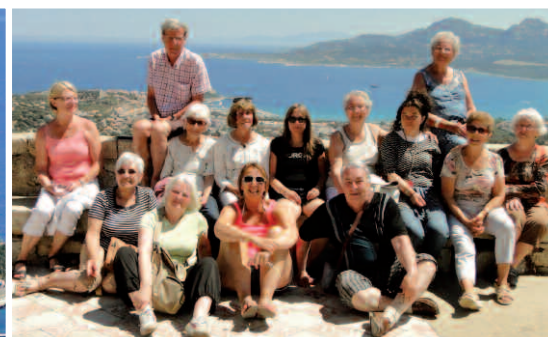
Voyage des seniors en Corse du 30 mai au 6 juin 2015