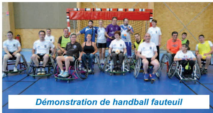
Démonstration de handball fauteuil