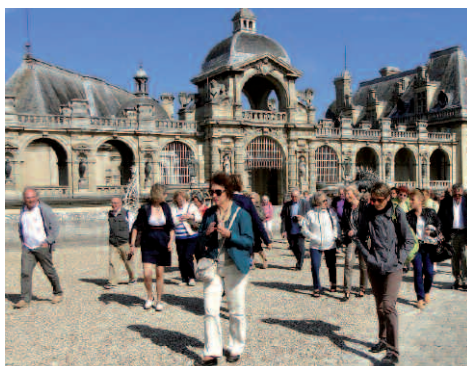
Sortie à Chantilly le 18 mai 2015