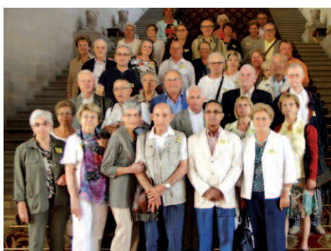
Visite du Sénat le 29 juin 2015