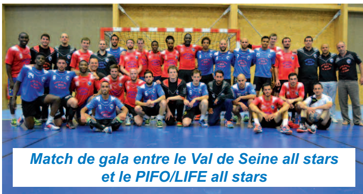
Match de gala entre le Val de Seine all stars et le PIFO/LIFE all stars